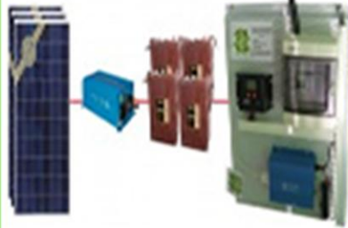
KIT ENERGIA SOLAR AUTOCONSUMO CON BATERÍAS